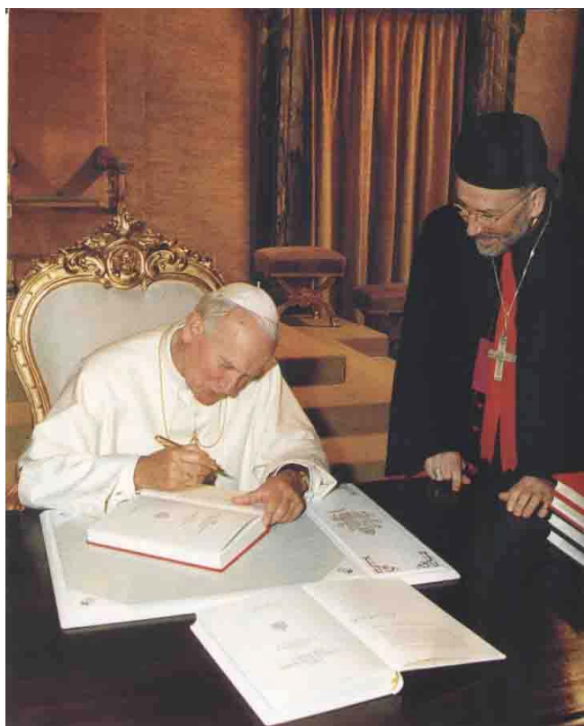
Jean-Paul II promulgue le Code des Canons des Églises Orientales (18 octobre 1990)

Le canon 75 (ancien canon 235 promulgué par Pie XII ) du Code de droit canon oriental foudroie l'argument du recours au rite Maronite du patriarche indûment invoqué par le Sel de la terre afin de prouver la prétendue validité sacramentelle du nouveau rite de consécration épiscopale de 1968.