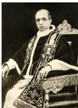
Pie XII qui promulgua motu proprio la lettre apostolique Cleri Sanctitati (2 juin 1957)

Parmi les Canons du Titre IV consacré aux Eglises patriarcales, le canon 75 (dans le CCEO de 1990) correspond au canon 235 12 dans le motu proprio Cleri Sanctitati de Pie XII (2 juin 1957).