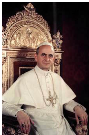
Giovani Baptista Montini – Paul VI