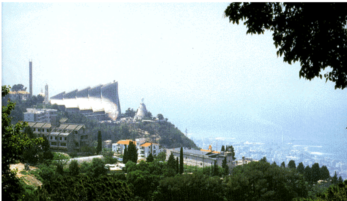
Notre Dame du Mont Liban - Bkerké