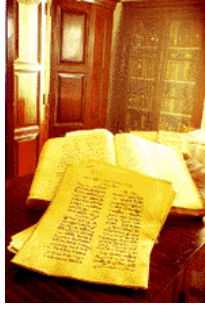
Manuscrits à Bkerké