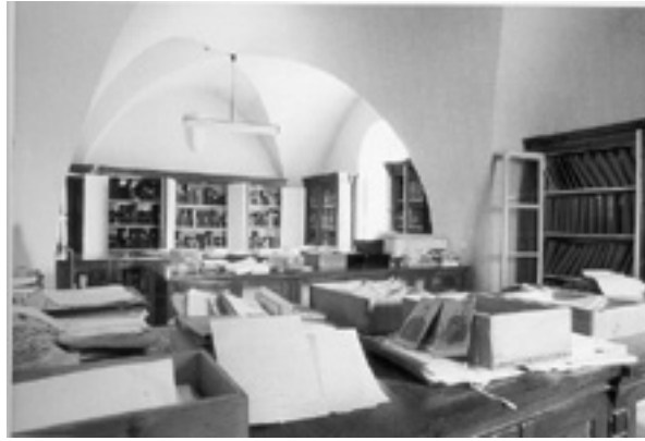
Bibliothèque patriarcale de Bkerké

Le manuscrit écrit entièrement en syriaque contient 118 feuilles. Il comprend, dans les feuilles 76 à 99 :